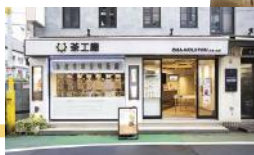
⑨大きな窓にすわりと並んだ特製のドリップマシンが目印