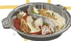
ヤマダデンキ LABI LIFE SELECT 自由が丘